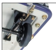
小型ドラムブレーキ 新開発