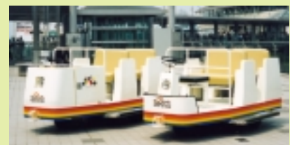
場内遊覧用バッテリー車