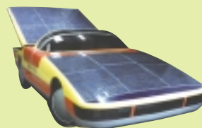
ソーラーカー(レース用)