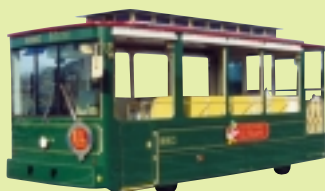
バッテリー式遊覧バス